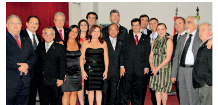
Autoridades da Odontologia durante a solenidade de posse do novo plenário do CRO-Pará

"A posse dos novos membros da diretoria é um momento de reafirmar que continuaremos sempre ao lado dos cirurgiões-dentistas e da sociedade, na luta por uma saúde melhor, uma assistência odontológica de qualidade e principalmente defender efetivamente a ética odontológica", declarou o presidente do CRO-PA.